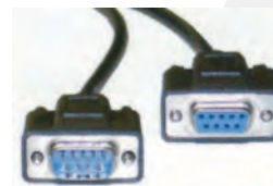
Cable serie DB9 M/H