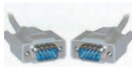
Cable serie DB9 M/M